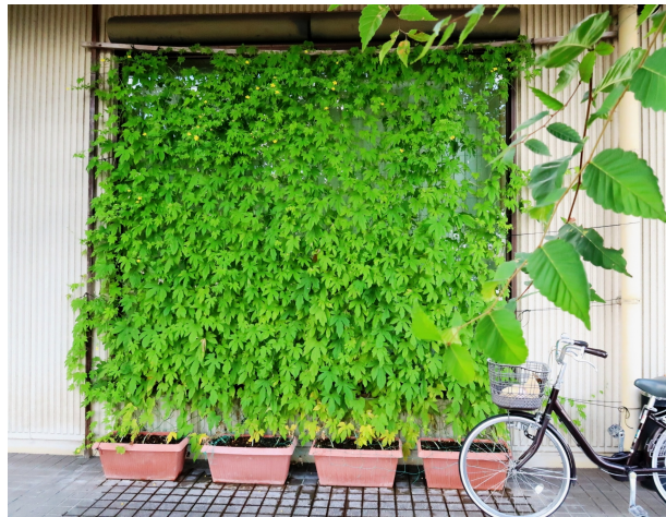
駅前通りで人目を引くつどえ～るの緑のカーテン＝8月4日

井原高校が育てたゴーヤの苗650ポットを4月16日、市民に配布したつどえ～る。施設の西側(上)と南側(右)でもプランター栽培をして省エネ効果を発揮中です。