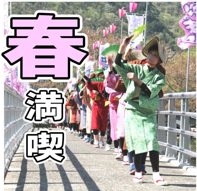
踊りながら桜橋を渡る道中おどり連 4月8日

井原町まちづくりの会（つどえ〜る登録団体）主催の井原桜まつりが4月8日、桜橋公園を主会場に開かれました。