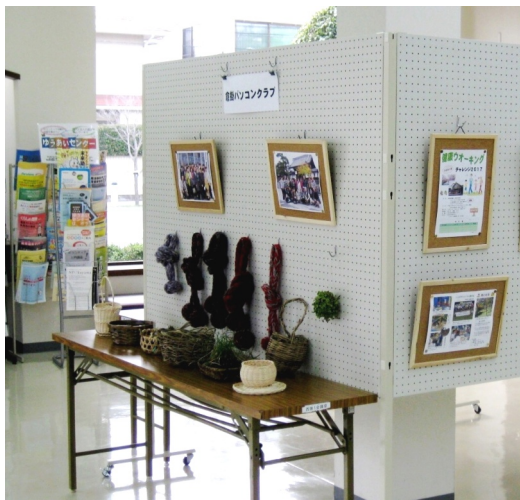
4枚のパネルは工夫によって効果的な展示場に早変わり＝つどえ〜る1階