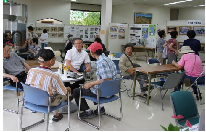
展示コーナーを見学後にカフェでつるぐ人たち

「私たちから地域へ」をテーマに、つどえ～るフェスタ2016パネル展が8月27日～28日、登録23団体などの協力を得て開かれました。48面のパネルへは、写真や作品などが展示され、普段の活動を個性的に演出。見学に訪れた井