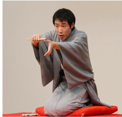
ゲストの落語家・桂小鯛氏