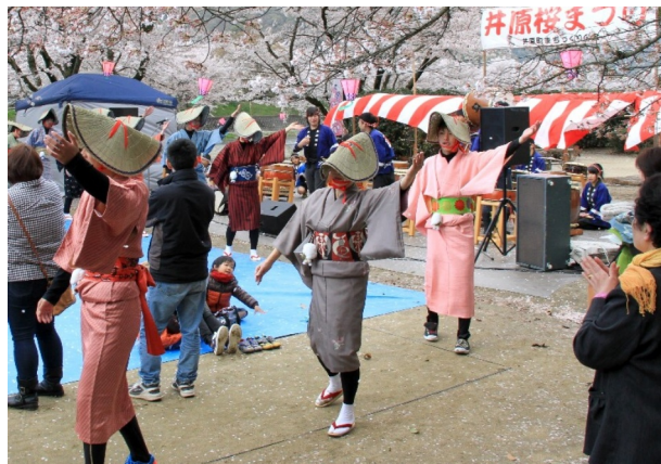
「井原★まんてん」の曲に乗って道中おどりを披露