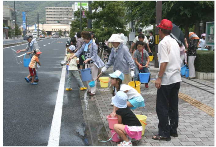
井原では三回目の開催となる打ち水大作戦「つどえ」の前