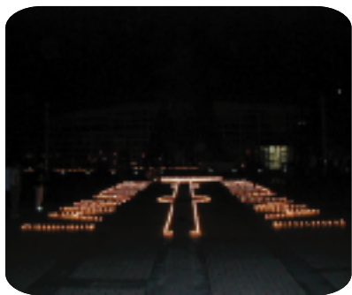
100万人のキャンドルナイト in井原駅

BDF燃料の製造のためには、廃食油を一般家庭や事業所から安定して回収する必要があるということで、市民、事業者、行政の協力が不可欠です。回収から製造までの運営については、平成16年度の検討時点ではNPOやボランティア団体に担っていただくことを前提として検討しており、現時点でのBDF導入というのは困難である。市内にBDFを扱う業者が無いので供給が難しいので公用車には使用できない。今後も低公害車の購入に努めたい。2輪車については環境面から近場は自転車の使用がよいと思う。