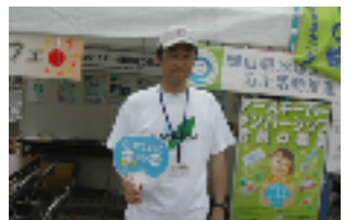
井原市環境フェアーにて

「100万人のキャンドルナイト in井原駅」でんきを消してスローな夜を。夏至の夜の風物詩となればとの思いで始めました。ちょっと立ち止まってゆったりとした時間を過ごしてみようだろうか。次は冬至(12月22日、井原駅)に。癒されますよきっと。