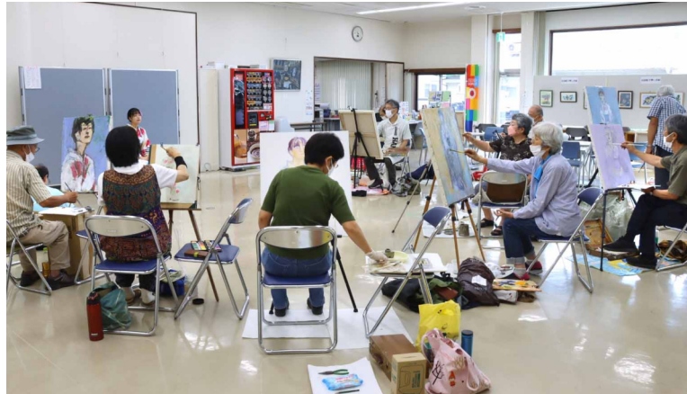
様々な角度からモデルを描く洋画部の皆さん=つどえ〜る