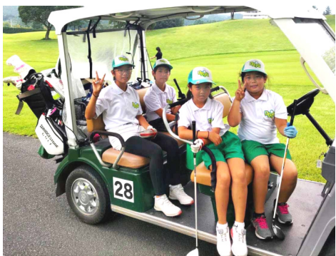
三重白山ヴィレッジゴルフコース

目的に毎週1回、出部小學校や井原ゴルフ倶楽部で練習をしています。22チームが出場した本大会は団体4人によるス