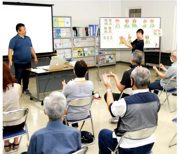
体験講座ながら学習内容は多岐に及んだ＝7月11日

2021年第1回手話体験講座(つどえ〜る & 井原聴覚障害者協会主催・井原手話サークル協力)が7月11日、つどえ〜るで午後1時30分から開かれ、市民ら約20人が参加しました。