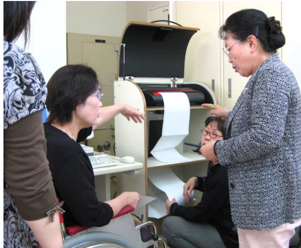
試運転をする井原ライトクラブの人たち