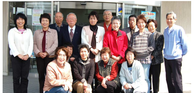
20年度最後のパソコン講座を終えた皆さん = 3月26日

つどえ～るパソコン教室の会員は、五月十九日現在四十八人。昨年四月にスタートした無料講座「つどえ～る 市民活動センター（つどえ～る）の指定管理者として、NPO法人市民交流ネットワーク井原が市から業務を引き継ぎ一年以上が経過しました。