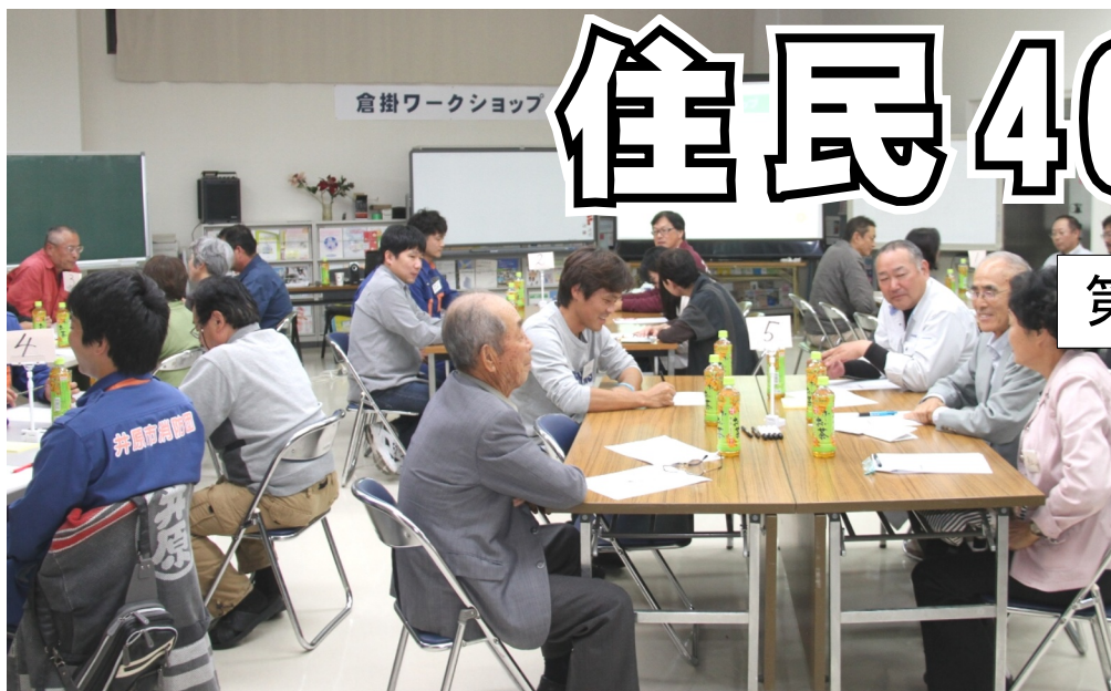
「地域の課題等は地元住民が一番よく分かっています」と議論は白熱