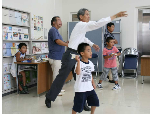
うちわ作り 紙ヒコーキ作り