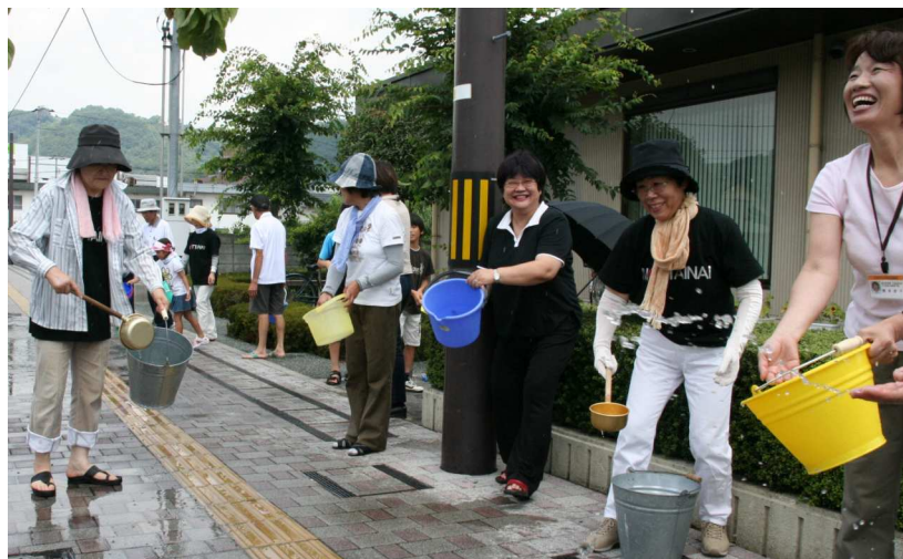
写真「つどえ」の前で昔ながらの打ち水を楽しむ参加者