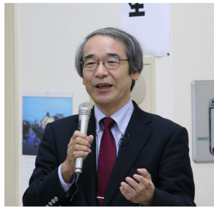
つどえ〜るで昨年12月3日、まちづくり講演会が開かれ、市民ら約70人が受講しました。