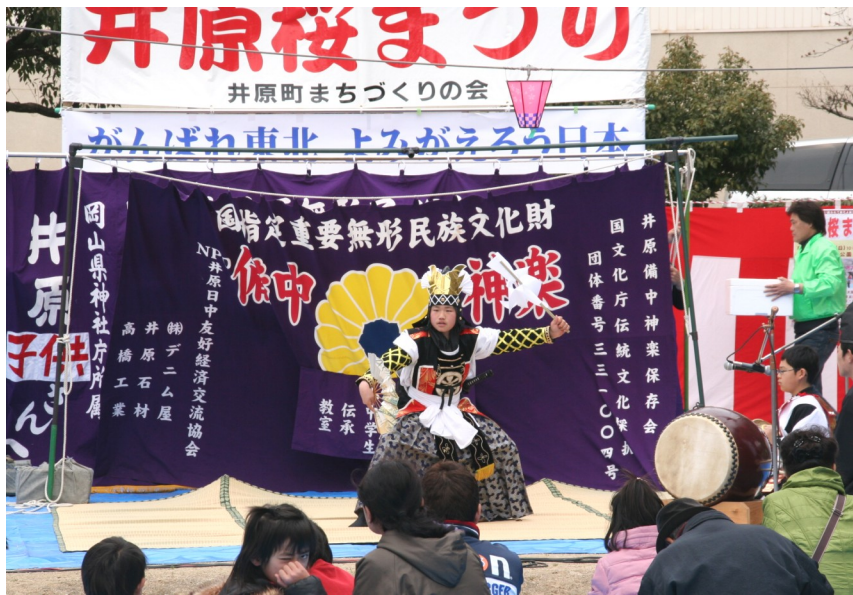
井原備中神楽保存会・小中学生伝承教室のメンバーによる熱演に会場から大きな拍手が送られていました＝4月3日・井原町桜橋公園