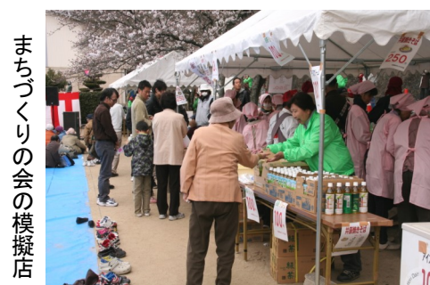
まちづくりの会の模擬店

井原備中神楽保存会・小中学生伝承教室のメンバーが子ども神楽を熱演。焼きそばやアイスクリームなどの模擬店は往時の桜まつりを彷彿させ、児童会館広場でも商