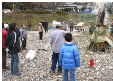
豚汁やおにぎりで体を温めました。

子どもサロンの一環 とまとさん家とんど&芋煮会 はっぴいひろば・とまとさん家が一月十五日、井原町桜橋上の河川敷でとんど・芋煮会(写真下)を開き、会員ら約四十人が参加しました。世代間交流、地域で子どもを育てるといった目的 の子どもサロン活動の一環として企画したもので、午前十時にとんどに点火され、持ち寄られた注連飾りなどが勢いよく燃え上がる中、参加者は無病息災を祈り、手作りの