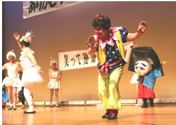
笑顔と拍手で沸いた北山ひまわり会のショー