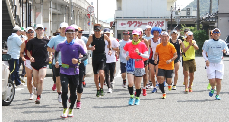
女性3人を含む26人が子守唄の里・高屋駅をスタート