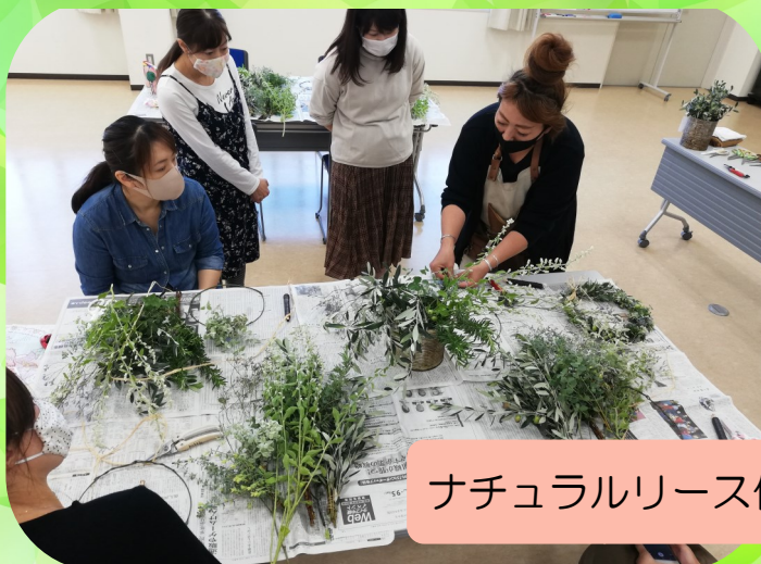
ナチュラルリース作り

年間に6回程度、活動場所は主に出部公民館です。近年参加者が減少傾向にありますが、多くの方に参加していただけたら幸いです。