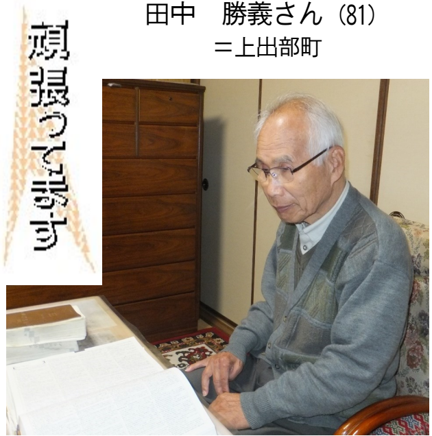
取得した資格一覧表 (2020年10月)