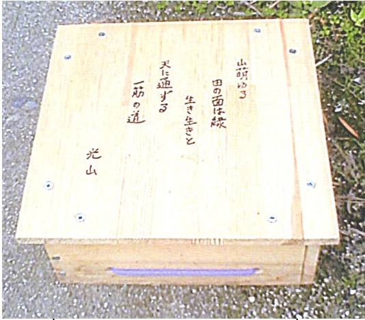
手作り椅子に読んだ一首

私が短歌を詠み始めたのは25年前の5月でした。仕事で津山へ向かう時、「川柳の郷 久米南町」と書いてある石碑が目飛び込んできました。すかさず、ひとつの思いが湧きでてきました。「よし、わしは川柳と言わず、和歌を始めよう」と強くはつきりと決心しました。そのとき詠んだ私の発句は次の歌です。