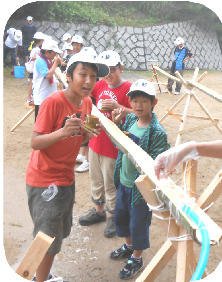
中部少年団（7月4～5日、経ヶ丸）