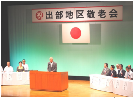
いつまでもお元気で

出部地区敬老会が9月12日、アクティブライフ井原メルヘンホールで開催され、75歳以上の対象者1000人のうち、138人が集まりました。