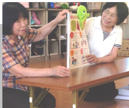
紙芝居やゲームで交流