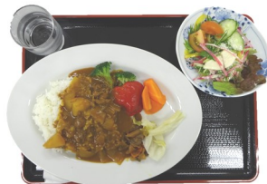
週替わりのミニランチ