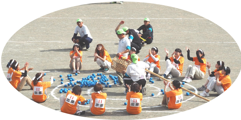
入ったり112個!!新記録