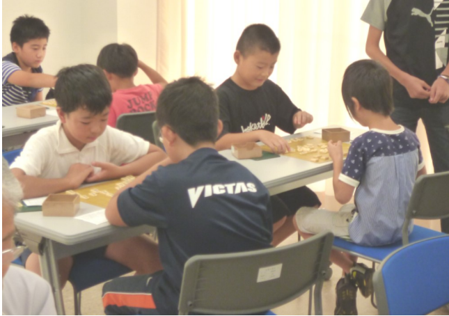
少年棋士、盤上で火花

8月23日、出部公民館主催「夏季囲碁・将棋大会」が出部公民館で行われた。囲碁の部38人、将棋の部24人が出場。盤上で熱い戦いを繰り広げた。