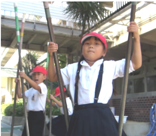
竹馬に乗る子どもたち