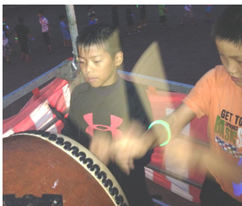
下出部夏祭り （8月13日）