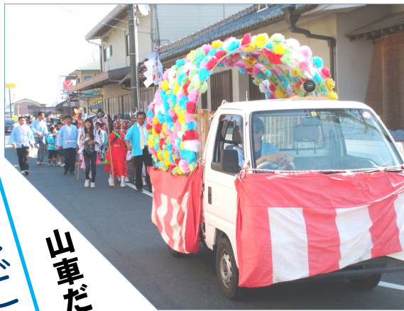
笹賀八幡神社 (10月18日)