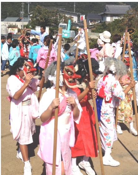
下出部八幡神社 (10月18日)