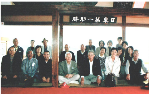
対潮楼で記念撮影