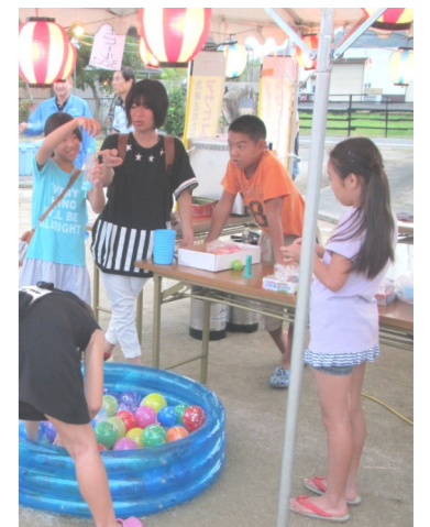
七日市夏祭り （8月13日）