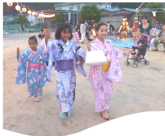
銅大橋鯨子供会夏祭り（8月14日）