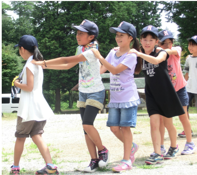
七日市少年団（7月11～12日、弥高山）