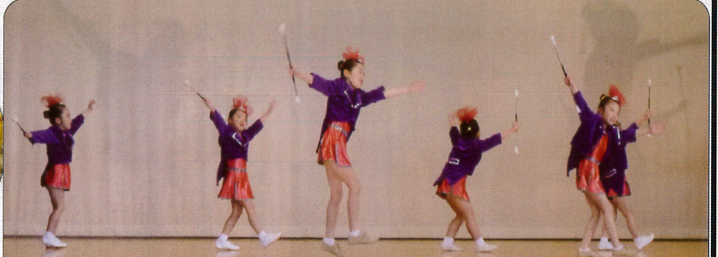
バトントワリング