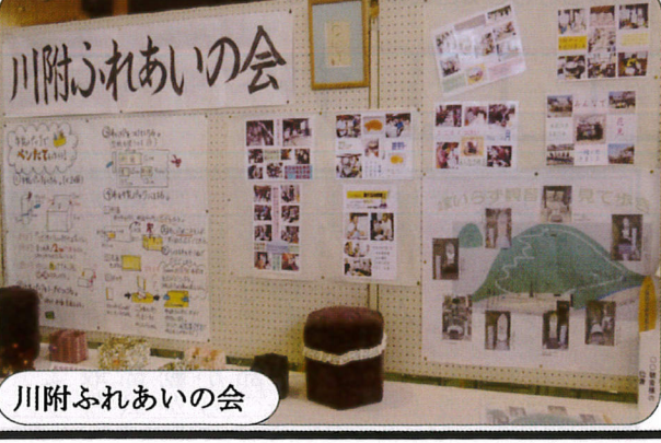
川附ふれあいの会