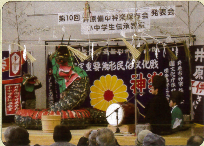
井原備中神楽保存会小中学生伝承教室発表会 (2/10)