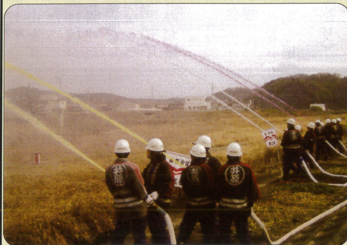
消防団出初式記念放水 (1/20)