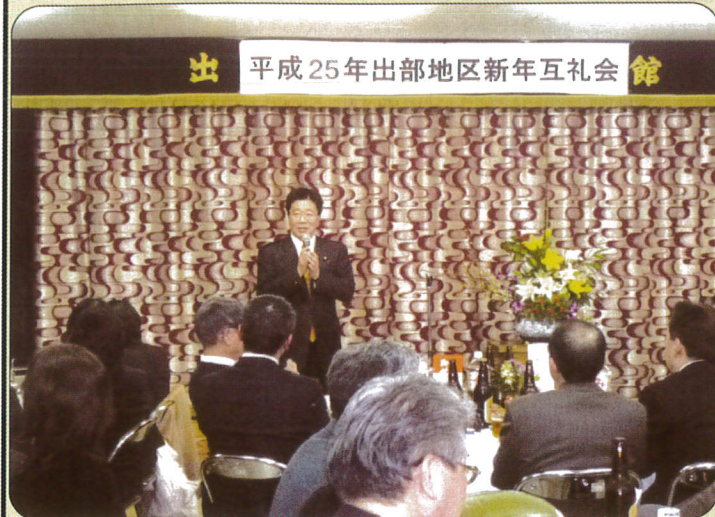
出部 平成25年出部地区新年互礼会 館