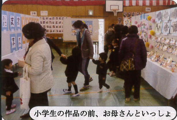
小学生の作品の前、お母さんといっしょ