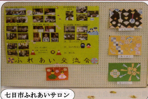
七日市ふれあいサロン