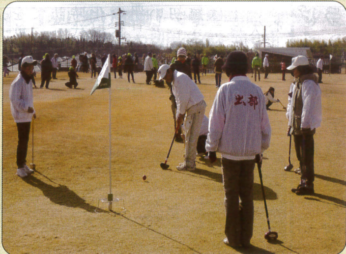
井原市公民館対抗グラウンドゴルフ大会 (12/22)