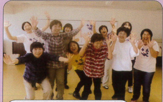
わっはっは、笑う門には福来る

笑いヨガは、笑いの体操とヨガの呼吸法を組み合わせた健康体操です。みんなで楽しく体を伸ばしたり、筋力をつけたり、笑って元気アップしませんか。