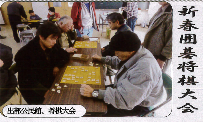
出部公民館、将棋大会