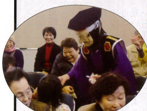
子供神楽、大黒様が客席へ