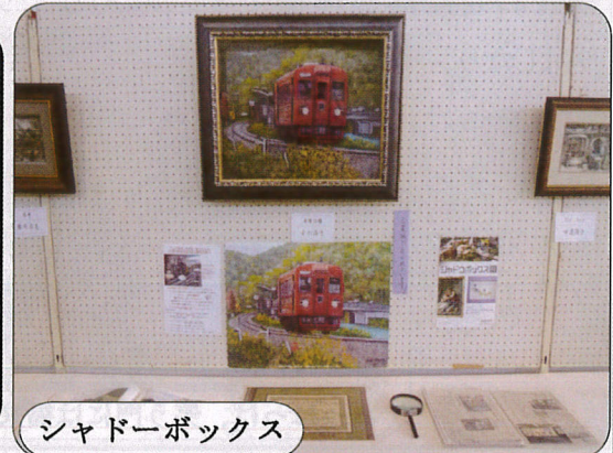
シャドーボックス