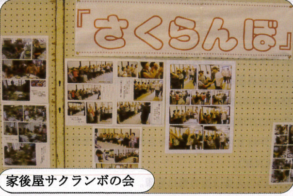
家後屋サクランボの会