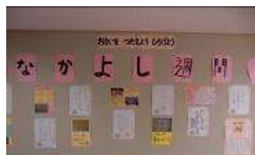
なかよし週間の活動の掲示

また、一年生と六年生、二年生と五年生、三年生と四年生が兄弟学年として一緒に、長縄やドッジボール、鬼ごっこなどの「なかよし遊び」を楽しみました。