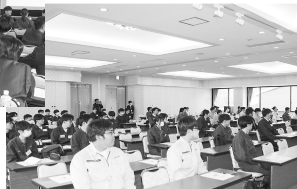
▲講師の話を真摯に聞く新入社員