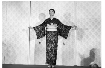
▲デニム着物を披露する元ミス・ユニバース・ジャパンの町本絵里様

創立20周年記念事業として、「白ブレザーの作製」、「平柳田中美術館へのガーデンテーブル・チェアの寄贈」、「創立20周年記念誌の発行」を行いました。