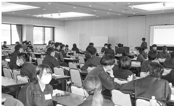
▲白熱するグループワーク

参加者は「楽しく学ぶことができた。今までなんとなく使っていた敬語が間違っているところが多かった。社会人としての自覚をもって今後に活かしていきたい。」と述べ、「会社の役に立つ人材になりたい。」や「大きな仕事を任せられる人材になりたい。」といった3年後のビジョンについても明るく語っていました。