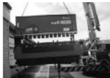
宮城県・仙台市に向け、東京商工会議所会員企業の敷地から運び出される機械(H23/11)

旋盤、ボール盤、コンプレッサ、溶接機、プレスブレーキ等の機械については依然として要望が多いため、引き続き、皆様のご協力をお願いします。