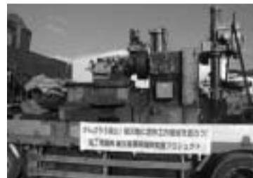
岩手県・大船渡商工会議所の会員企業に搬入された機械(H23/12)