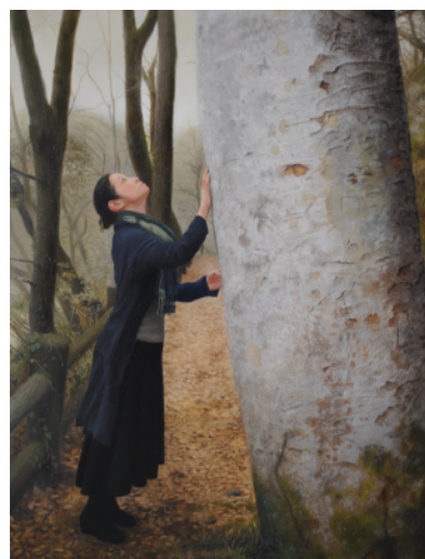
1 真実に到達するための方法 真実とは何か？（部分）/変形(180×90 cm) 2010年 2 たど見えなくとも 力強くそれは存在している /変形(53.5×41.5 cm) 2011年 3 私自身を持って余す事のない 私より小さく広い器 /F6(40.9×31.8 cm) 2015年 表紙 止まない孤独と 向き合う事の苦悩 /S12(60.6×60.6 cm) 2012年